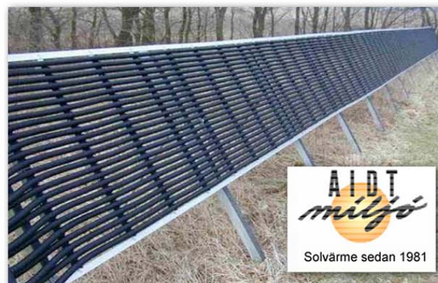
Bilden visar en markmonterad Energisolfångare avsedd för en 25kW's värmepump

Genom att installera en Energisolfångare elimineras risken för permafrost och anläggningens totala värmeeffekt ökar avsevärt.