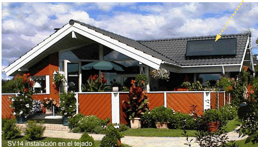
SV14 instalación en el tejado

Nos reservamos el derecho a hacer modificaciones.