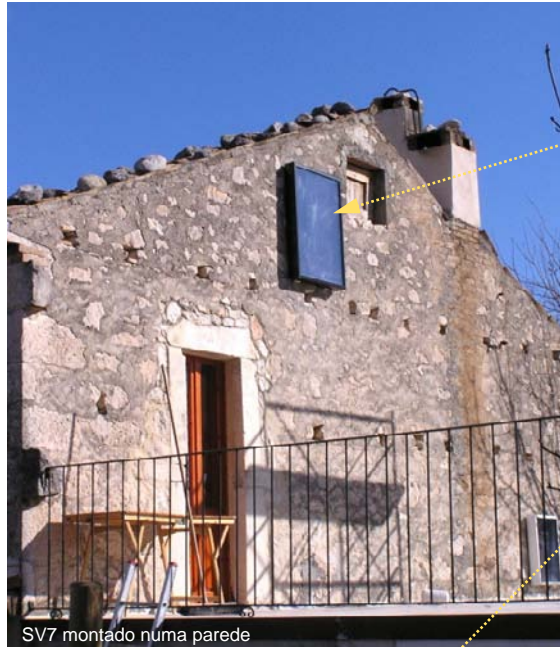
SV7 montado numa parede

A ventoinha SolarVenti tem a capacidade de 50-150 m 3 /h, o que assegura uma insuflação contínua de ar ambiente. Quaisquer humidades e cheiros são rapidamente removidos e a energia extra ajuda no aquecimento da casa.