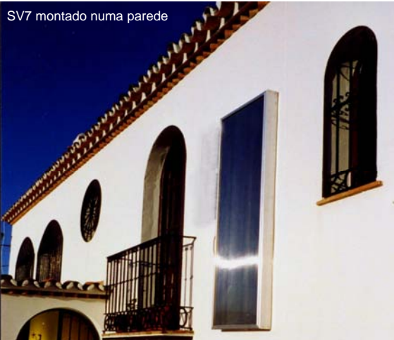
SV7 montado numa parede