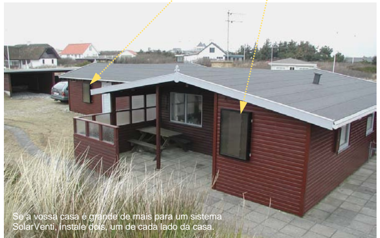
Se a vossa casa é grande de mais para um sistema SolarVenti, instale dois, um de cada lado da casa.