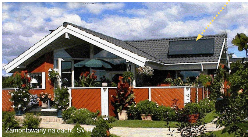
Zamontowany na dachu SV14

Wszystkie modele można montować poziomo lub pionowo na ścianie. Kąt nachylenia w stosunku do poziomu powinien wynosić minimum 60°. Dopłata za kolor do modelu SV 3 i SV 7 wynosi 250DKK. SV 14 wynosi 375DKK. Dopłata za wyłącznik do SV3 i SV7: 250 kr. Dopłata za regulator wynosi 850DKK.