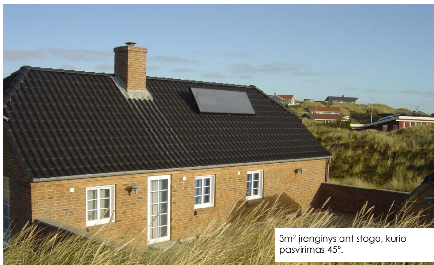
3m 2 įrenginys ant stogo, kurio pasvirimas 45°.

Oras traukiamas per juodą, patvarią filtravimo medžiagą, kuri yra sušildoma saulės spindulių. Giedromis dienomis, kai sistema dirba daugiausiai, oras yra labiausiai išgryninamas ir išdžiovinamas. Žinoma yra ir tokių dienų kai sistema neveikia, bet patirtis rodo, kad daugelį dienų veikianti sistema labai pagerina vidinį pastato klimatą. Saulei šviečiant, sistema SV30, ne tik grynina orą, bet ir gali pagaminti apie 1 – 2 kW energijos. Norint pašalinti pelėsių ar specifinį "vasarnamio" kvapą labai svarbi oro cirkuliacija. Vasarnamiuose, kurių viduje yra įrengtas baseinas, įrenginio pagalba pašalinamas chloro kvapas, bei didžioji dalis drėgmės.