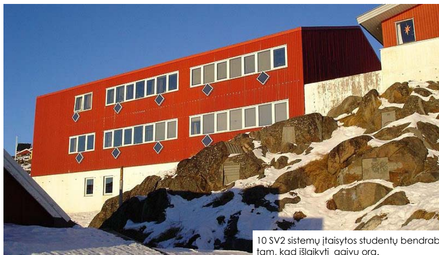
10 SV2 sistemų įtaisytos studentų bendrabutyje tam, kad išlaikyti gaivų orą.

Oras traukiamas per juodą, patvarią filtravimo medžiagą, kuri yra sušildoma saulės spindulių. Giedromis dienomis, kai sistema dirba daugiausiai, oras yra labiausiai išgryninamas ir išdžiovinamas. Žinoma yra ir tokių dienų kai sistema neveikia, bet patirtis rodo, kad daugelį dienų veikianti sistema labai pagerina vidinį pastato klimatą. Norint pašalinti pelėsių ar specifinį "vasarnamio" kvapą labai svarbi oro cirkuliacija. Vasarnamiuose, kurių viduje yra įrengtas baseinas, įrenginio pagalba pašalinamas chloro kvapas, bei didžioji dalis drėgmės.