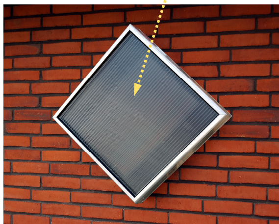
SV2 може встановлюватися ось так – ми назвали її "Діамантовою моделлю"