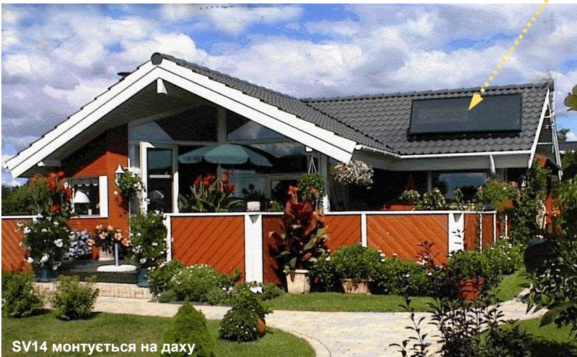
SV14 монтується на даху

Виробник залишає за собою право на внесення змін